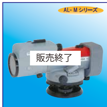
測微装置 SM6 (AL-M用) ¥88,000 (税抜¥80,000)