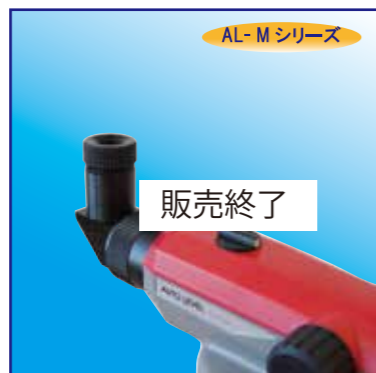
エルボアイピース SBL3 (AL-M用) ¥38,500 (税抜 ¥35,000)