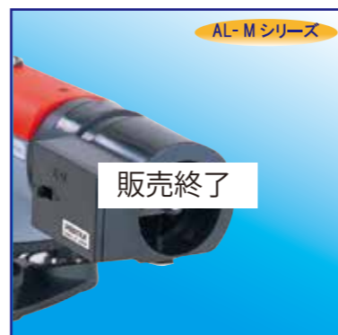
照明装置 EP2 (AL-M用) ¥16,500 (税抜 ¥15,000)

水準測量や土木建設工事などで標尺を高精度に読み取る場合に使用し、標尺の目盛を最小0.1mmまで読み取ることが出来ます。