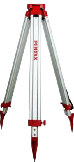
TR-6 標準価格 ¥27,500 (税抜 ¥25,000)