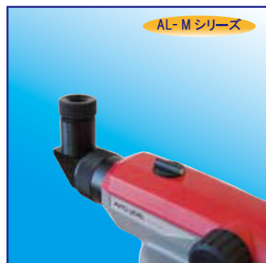
エルポアイピース SBL3 (AL-M用)

狭い場所や低い位置に本機を据えつけたい時など、接眼レンズを正面からのぞきにくい場合に使用します。接眼レンズの取付部が回転し、上又は横方向から視準でき、目標を楽な姿勢で観測することが出来ます。