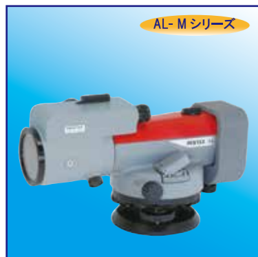
測微装置 SM6 (AL-M用)

水準測量や土木建設工事などで標尺を高精度に読み取る場合に使用し、標尺の目盛を最小0.1mmまで読み取ることが出来ます。