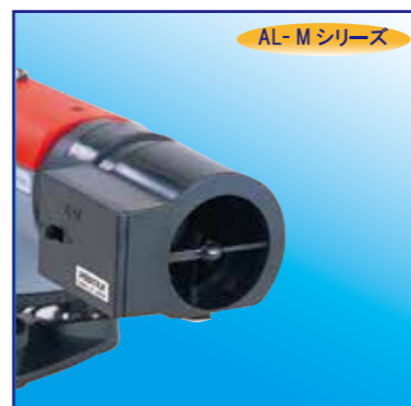
照明装置 EP2 (AL-M用)

望遠鏡先端に取り付け、トンネル内や夜間、あるいは明かりの少ない建物内など暗い場所における測量の際に使用し、十字線が照明されます。