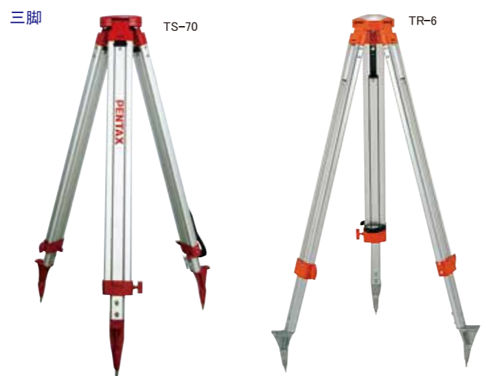
TS-70 標準価格 ¥27,000 (税抜 ¥25,000) TR-6 標準価格 ¥27,000 (税抜 ¥25,000)